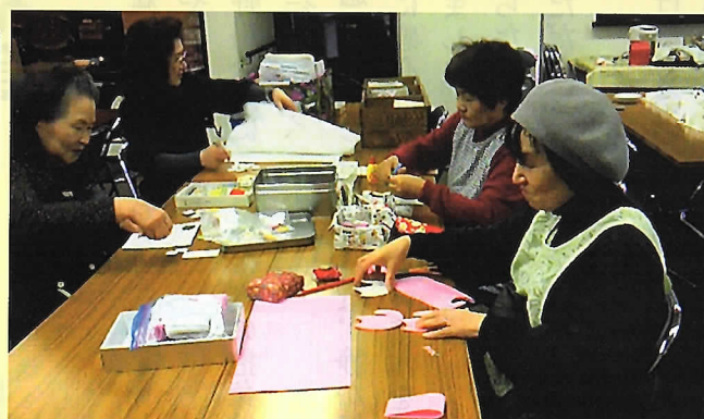
お仕事会で 楽しく作業中!

大盛況のクリスマス礼拝! 地区の教会からも大勢参加。 礼拝堂がいっぱいで とても賑やかです。 いっぱいのおもてなし