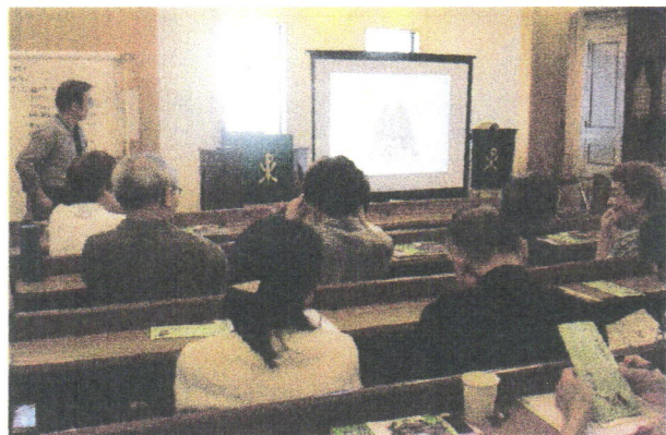
咸宜園についての学び