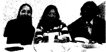
同年代の女性メンバーたちと

女性の働き 3月には私と同年代の女性メンバーが、大学の教員で南極に研究に行かれ、報告会をしていただきました。京都に留学経験もあり、京都教会でお交わり頂いたそうです。ご高齢の日系一世の方に加え、二世のポルトガル語メンバーやデカセギから帰国された母子、スペイン語を話すボリビア人も定着されて喜んでます。また、男性駐在員も定着し、広がり世代交代を祈りながら取り組んでいるところです。