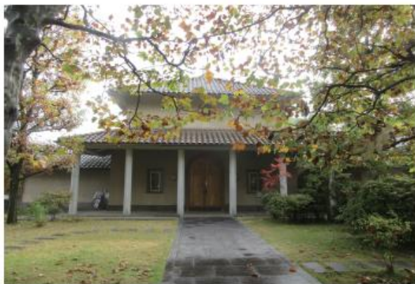
上写真：ナザレ修女会エピファニー館 下写真：研修会参加者

皆さま、それぞれの地でイエス様のご誕生をお祝いしておられることでしょう。2015年も終わりに近づきましたが国内、海外ともに心痛むことが多くあった年でした。国内では7月の猛暑、8月の台風、北関東や東北での